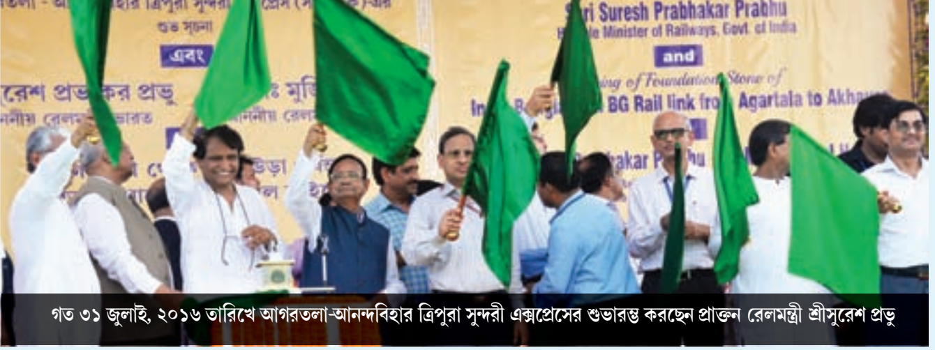
গত ৩১ জুলাই, ২০১৬ তারিখে আগরতলা-আনন্দবিহার ত্রিপুরা সুন্দরী এক্সপ্রেসের শুভারম্ভ করছেন প্রাক্তন রেলমন্ত্রী শ্রীসুরেশ প্রভু

প্রায় একটি দশক অপেক্ষা করার পর গত ইং ৩১ জুলাই ২০১৬ তারিখে ত্রিপুরা প্রবেশ করল ভারতবর্ষের ব্রডগজ রেলওয়ে মানচিত্রে। প্রাক্তন রেলমন্ত্রী শ্রীসুরেশ প্রভু করলেন আগরতলা-আনন্দবিহার ত্রিপুরা সুন্দরী এক্সপ্রেসের শুভারম্ভ।